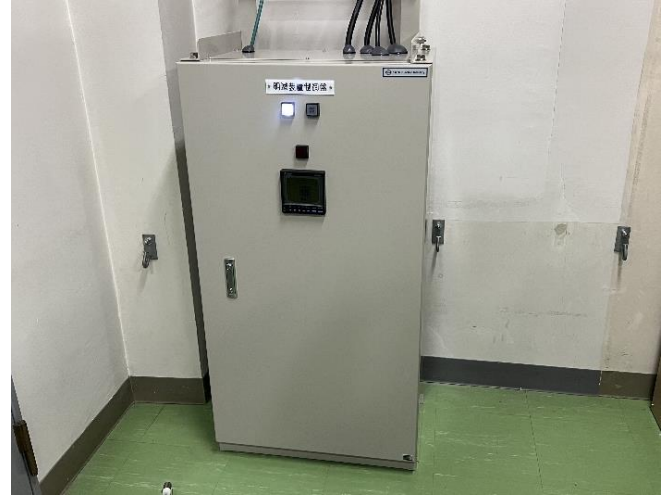
明滅装置制御盤(屋内設置)