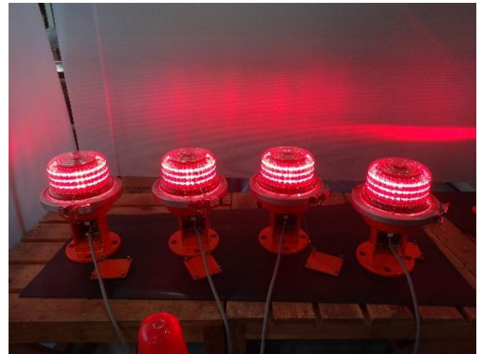
航空障害灯(不動灯)