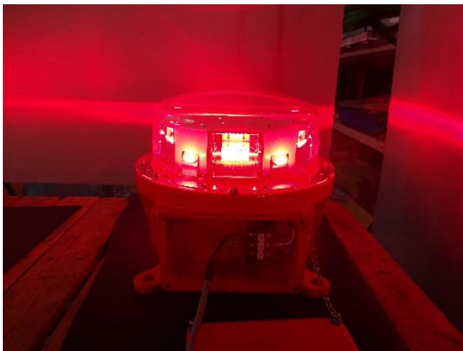
航空障害灯(明滅灯)