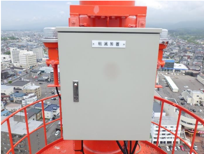
明滅装置(屋外設置)